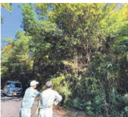
唐沢山への山道で茂った雑木の伐採整備を実施

けていきます。小中町交差点附近の 道路拡幅の要望を受け、このほど工 事が完了し渋滞緩和と児童生徒の安 全を確保できました。また、佐野田沼 線掘米町工区道路拡幅工事は、今年 度用地測量を開始しました。渋滞緩 和と住民の利便性向上のため引き続 き、皆さまの要望を承っていき ます。