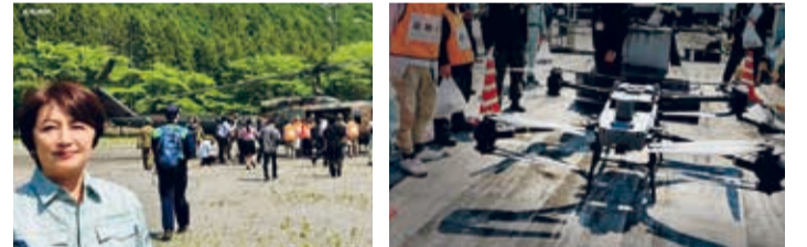
大地震で孤立した住民の救助手順を確認する実働訓練 (令和7年5月13日)を旧氷室小周辺で自衛隊や警察、消防、 地元のみなさんと連携し実施