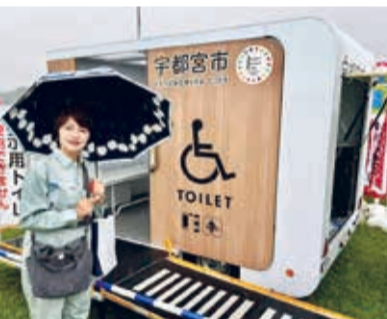
第73回利根川水系・水防訓練(令和7年5月17日)では 宇都宮市所有のトイレカーも展示