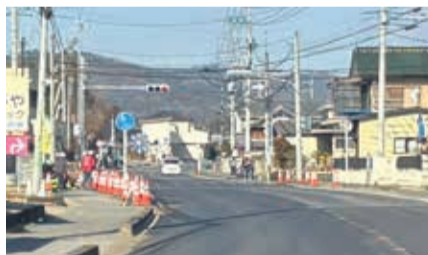
市内から小中地区へ向かう交差点の整備が進みました