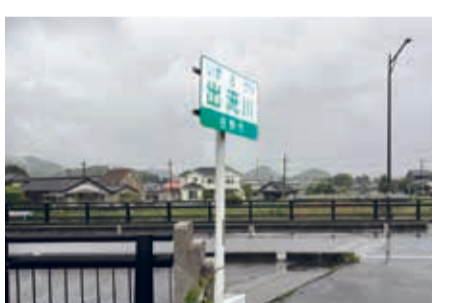
出流川の護岸整備も さらに北進しています

主要地方道佐野田沼線の 道路事業の進捗状況に ついて安足土木事務所 から説明会がありました