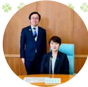
星副委員長と共に 令和7年度生活保健 福祉委員会委員長を 拝命致しました。