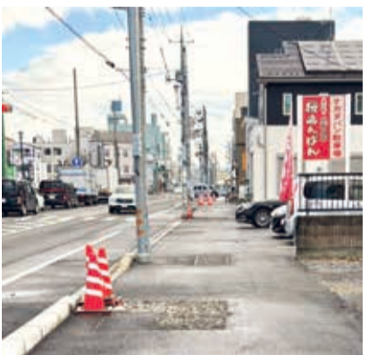
県道桐生岩舟線の整備も進んでいます